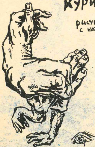
Любимый рисунок С. ОРЛОВА, иллюстрировавшего этот номер