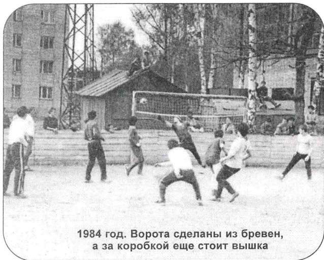
1984 год. Ворота сделаны из бревен, а за коробкой еще стоит вышка

Наверное, многим из вас интересно узнать, какова история развития футбола в нашем институте, чем занимались сегодняшние выпускники, когда они были еще студентами, с чего начинались Матчи Века, почему они игрались именно 24 часа и т.п. Эти и многие другие вопросы я задал выпускникам, так появилась эта статья.