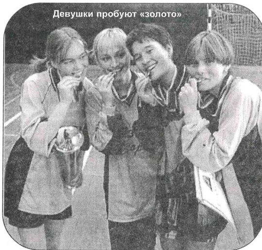
Девушки пробуют «золото»

демарш: «Уйди с экрана!» Вы даже не представляете, как меня злило то, что он не замечает моих прелестей! Сейчас взаимоотношения с лучшим другом строятся на совместном просмотре футбольных матчей и произнесении емких комментариев: — «Пас! Пас, я сказала!.. Ну-у!.. Вась, дай пива...»