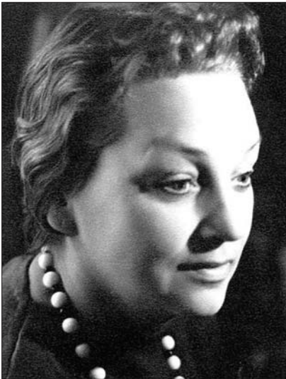
Станислава Валерьяновна Келдыш, 1964 г.