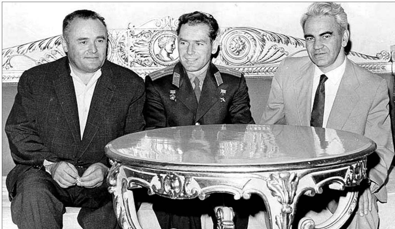
Слева направо: главный конструктор Королев С.П., космонавт №2 Титов Г.С. и академик Келдыш М.В. 1965 год

атмосферу плодотворного труда энтузиастов, первопроходцев в ряде направлений науки.